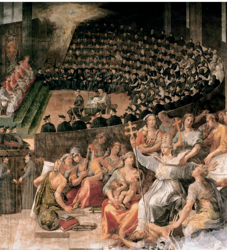
Pasquale Cati, Tridentinski koncil , freska, Rim, bazilika di Santa Maria in Trastevere

jednako jednostrana obuzetost ljubavnim osjećajima, koja uključuje brzoplet prezir prema novcu, tj. prčiji . Fenomen imetka posve je sporedan u Držićevim dramama s pastoralnim smještajem radnje, u kojima se likovi ne karakteriziraju po položaju na imovinskoj ljestvici, nego prema jačini i usmjerenosti erotske žudnje. Ekon. motivi pojavljuju se samo na rubu: u prvom prologu Tirene Vučeta i Obrad, hvaleći polit. prosperitet dubr. komune, ističu u pozitivnu svjetlu blagostanje njezine vlastele, a u Grižuli se Vukosava i Staniša žale kako zaljubljenost navodi mladež da zanemari korisne poljodjelske i stočarske poslove. Naravno, sporednost imetka u pastoralnim dramama također je relevantna književnopov. činjenica, jer je pastorala u ranom novovjekovlju, u doba kad su se afirmacijom trgovinskoga kapitala i građ. klase komplicirali imovinski odnosi, zapravo i služila kao protugađanski knjiž. refugium, tj. kao medij idealizacije tobože nepotkupljivih ljudskih vrlina (ljepote, nevinosti, plemenitosti, ljubavi, vjernosti).