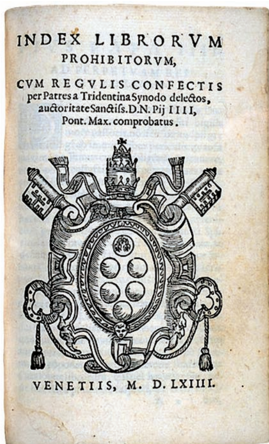
Index librorum prohibitorum, Venecija, 1564.