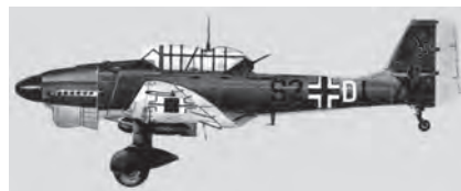
Hugo Junkers, JU 87