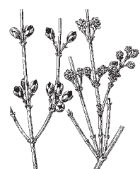
kositernice , dvoredna kositernica