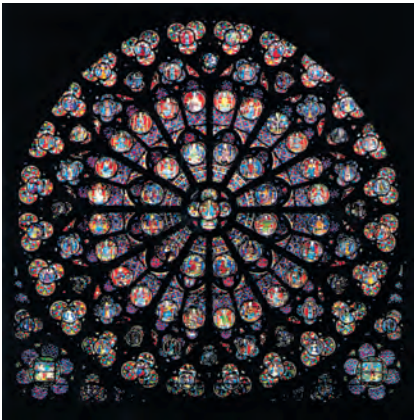
prozorska ruža, Notre-Dame, Pariz