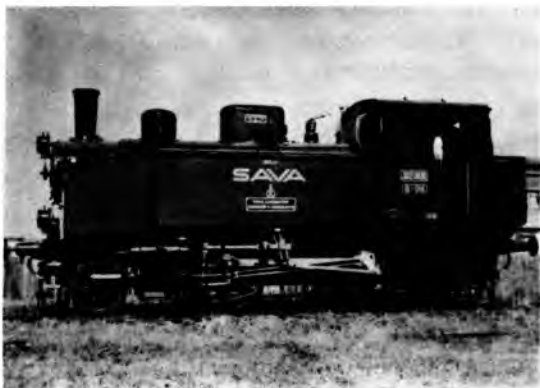
Sl. 3. Prva lokomotiva izrađena u Hrvatskoj (Tvornica vagona u Slavenskom Brodu, 1939)

Na slici 3 prikazana je prva od deset u seriji građenih lokomotiva 1-B-1 (serija 16). Ta je lokomotiva imenom »SAVA« bila prva lokomotiva izgrađena na prostoru Hrvatske, ujedno i na prostoru bivše Jugoslavije, a pokusna je vožnja bila 23. veljače 1939. na pruzi od Slavenskoga Broda do Nove Gradiške. Serijska proizvodnja tih lokomotiva u Tvornici prikazana je na slici 4, a nekoliko gotovih lokomotiva na industrijskome kolosijeku tvornice vidi se na slici 5.