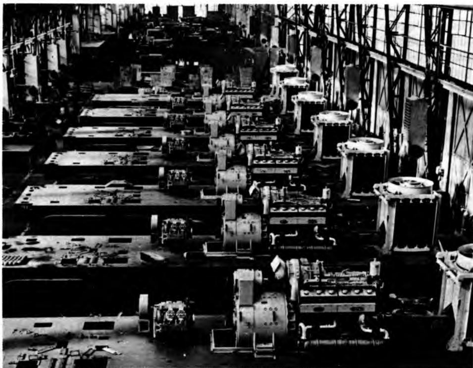
Sl. 6. Serijska proizvodnja dizelskih električnih lokomotiva DEL 825

Zamjena parnih lokomotiva motornim lokomotivama u svijetu, pa tako i u Jugoslavenskim državnim željeznicama, potakla je proizvodnju motornih lokomotiva u Tvornici vagona u Slavonskome Brodu. Već 1955. proizvedena je prva dizelska lokomotiva od 20 KS (prema današnjem sustavu mjernih jedinica 14,7 kW), a slijedi velik broj različnih dizelskih lokomotiva manjih i srednjih snaga, sve do 600 KS (441 kW). U velikom je dijelu te proizvodnje Tvornica vagona surađivala s austrijskom