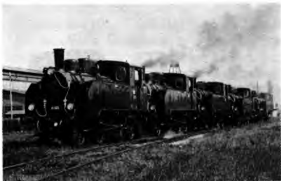
Sl. 5. Lokomotive 1-B-1 (serija 16)

Od parnih su se lokomotiva kao posljednje u Tvornici proizvođile tzv. lokomotive bez vatre. One su građene do 1967. godine, a upotrebljavale su se pretežno u rafinerijama nafte i u kemijskoj industriji. Vrijedno je još spomenuti da je Tvornica pri kraju svog rada na parnim lokomotivama izgradila i lokomotivske parne kotlove za potrebe jedne od zapadnonjemačkih tvornica, koja je te kotlove ugrađivala u zupčane lokomotive željeznica u Indoneziji.