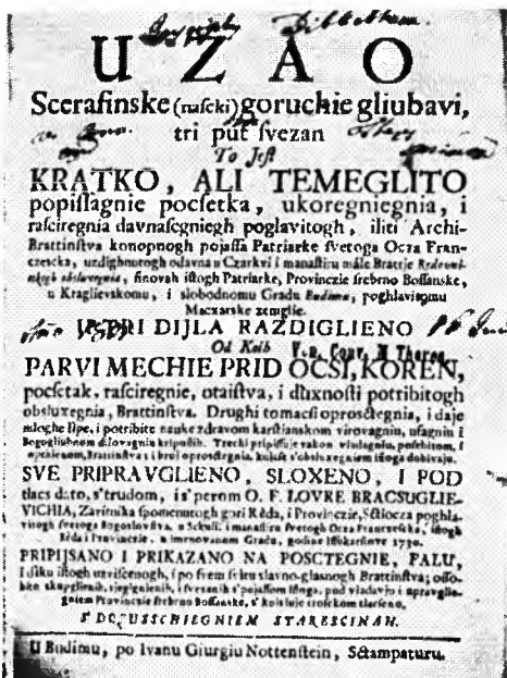
Lovro Bračuljević: Uzao serafinske (naški) goruće ljubavi, (...), Budim, 1730.

Ima u ovoj Bibliografiji nedosljednosti. Spomenuo bih neke. Kujundžić kraj nekih bibliografskih jedinica spominje knjižnicu u kojoj se djelo čuva, a također i F (fotografiju). Što to znači? Evo primjera: na str. 709, bibliogr. jed. 239. zabilježeno je da knjižicu posjeduje B k, F. Već sam spomenuo da Bunjevačka knjižnica (B k) nije uređena, nema svoga kataloga (stručno obrađenoga) a o fotografijama se doista baš ništa ne zna, niti su objavljene. Vjerojatno bi se osoba koja želi čitati ili proučavati djelo, morala zadovoljiti da je potraži drugdje. Ovo nije jedini primjer. – Zanimljivo je, također, pripomenuti da je na str. 767. pod br. 211. zabilježeno djelo kojemu nije označen pisac, nego samo nakladnik.