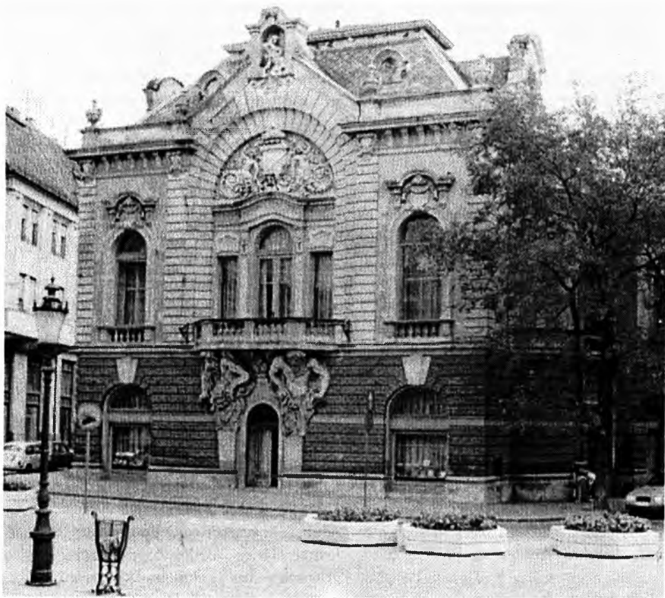
Gradska knjižnica, Subotica