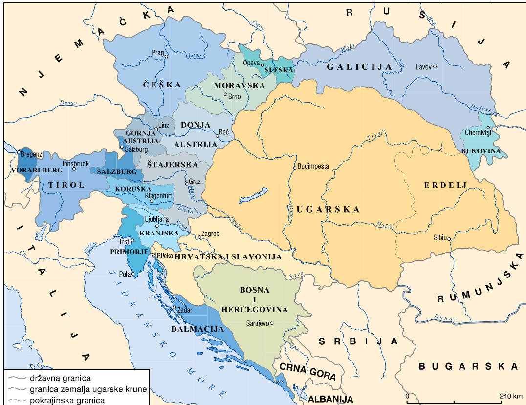
Austro-Ugarska pred Prvi svjetski rat

Ugarske, tzv. Zemalja Krune Svetog Stjepana. Time je okončana višedesetljetna unutarnja politička kriza koja je kulminirala u ugušenim revolucionarnim i ratnim zbivanjima 1848–49, nakon čega je uslijedilo dvadesetljetno razdoblje carskog apsolutizma, centralizma i suspenzije rada svih parlamenata. Put Nagodbi utrlj su sve veći vanjskopolitički neuspjesi Monarhije: gubitak kontrole nad Dunavom Pariškim mirom 1856, gubitak Lombardije u ratu za talijansko naslijeđe s Kraljevstvom Sardinijom (tzv. Pijemont-Sardinija) 1859, vojni poraz od Pruske 1866, gubitak Venecije u korist ujedinjene Kraljevine Italije te isključenje iz Njemačkoga saveza, odnosno dovršetak procesa ujedinjenja Njemačke oko Pruske, a bez habsburških nasljednih zemalja (→ EUROPA U MATOŠEVO DOBA ). Carskim je ukazom 1860. u Monarhiju vraćena ograničena ustavnost, ali i »povijesna individualnost« pojedinih zemalja (uključujući Hrvatsku i Ugarsku s njihovim nerazriješenim odnosom; → HRVATSKA U MATOŠEVO DOBA ). No kako su 1861. Ugarski i Hrvatski sabor odbili poslati zastupnike u Carevinsko vijeće i time priznati svoju podređenost,