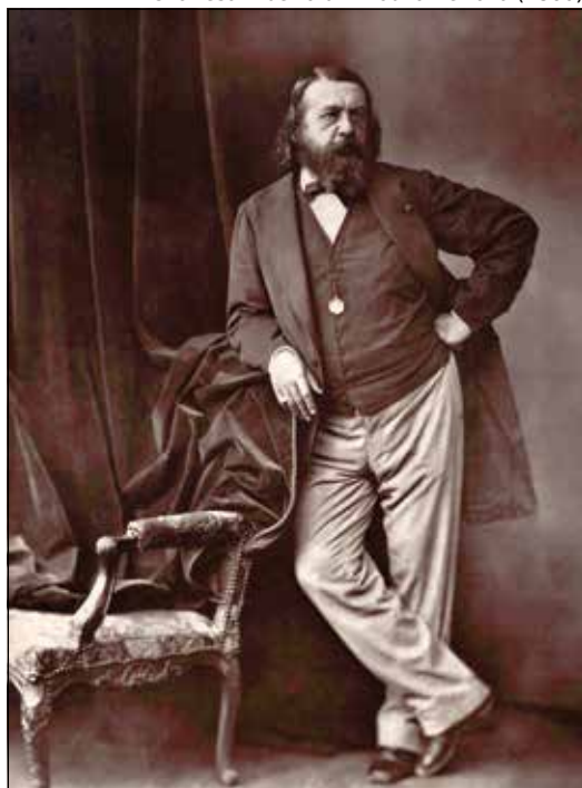
Théophile Gautier na fotografiji Charlesa Alberta d'Arnouxa Bertalla (1860)

dotaknuo, pa tako i prema temi domovine, pojednostavljivanje njegova književnog djela.