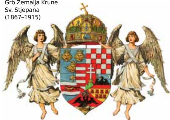
Grb Zemalja Krune Sv. Stjepana (1867–1915)

Ugarska. Matošev je feljtonistički opus obilježen negativnom slikom Mađara kao gušitelja hrvatske samostalnosti. U nemogućnosti političkog otpora Matoš je borbu prenio na kulturno polje, tj. na pamfletsko predstavljanje Mađara kao kulturno inferiornoga, barbarskoga i neciviliziranoga naroda, »uljeze« i »parazite evropske kulture« (V, 165), a mađarski jezik, kao izdvojen ugrofinski jezik unutar indoeuropskih jezika, držao je za barbarski, »turski« idiom i »altajski« jezik (XV, 107–108; suvremena je lingvistika odbacila povezanost ugrofinskih jezika s turkijskima, kao i sa spornim tzv. altajskim jezicima). Mađarski je jezik stoga, po Matošu, suvišan »obrazovanom Europejcu«, »inferiorniji od našega« i »bez više kulture«. U Dojmovima sa pariške izložbe 1900. pisao je i o ugarskom paviljonu, držeći da je njegova »izložba historijska, jer osim povijesti Ugarska gotovo ništa nema pružiti Europi« (III, 140), posebice ne u područjima kulture, umjetnosti i znanosti. Takav je stav dodatno zaoštrio u pamfletu Mađarska kultura (1904), uz ciničnu napomenu da on sam ne zna što je mađarska kultura jer je »dobar Europejac«. Ugarsku nagodbena doba Matoš je okarakterizirao kao velikašku i novčarsku oligarhiju koja posjeduje »sa Crkvom oko