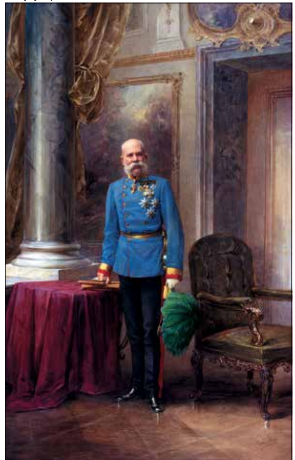
Franjo Josip I.

Matoš je mnoge svoje članke posvetio političkim, društvenim, gospodarskim i kulturnim pojavama te problemima Hrvatske u Austro-Ugarskoj, pri čemu je njegova perspektiva bila određena hrvatskim položajem u višenacionalnom imperiju, a prije svega u Ugarskoj. »Proljeće naroda« 1848. tumačio je kao