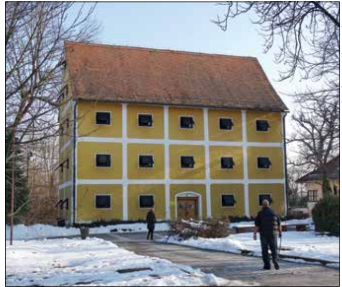
MUZEJ MATIJE SKURJENIJA

God. 2002. otvoren je središnji dio novoga stalnog postava, koji se kontinuirano nadopunjuje novim predmetima i sadržajima. Postav je djelo autorskoga tima, nastao na temelju muzeološke koncepcije V. Malekovića te stručnih suradnica iz Muzeja. Arhitektonsko i likovno oblikovanje djelo su arhitekta Marija Beusana. Postav je vezan uz život feudalnoga društva i prošlost Hrvatskoga zagorja, a Seljačka buna smještena je u širi kontekst. Središnji dio postava posvećen je Seljačkoj buni 1573. Predstavljani su i grofovi Oršići, koji su sagradili dvorac te ostavili vidljiv trag u povijesti stubičkoga kraja. Od 2004. u podrumu dvorca prikazana je jedna od značajnih gospodarskih grana Hrvatskoga zagorja – proizvodnja vina. Dvorac okružuje perivoj sa spomenikom Seljačkoj buni i Matiji Gupcu i drugim radovima na temu Seljačke bune.