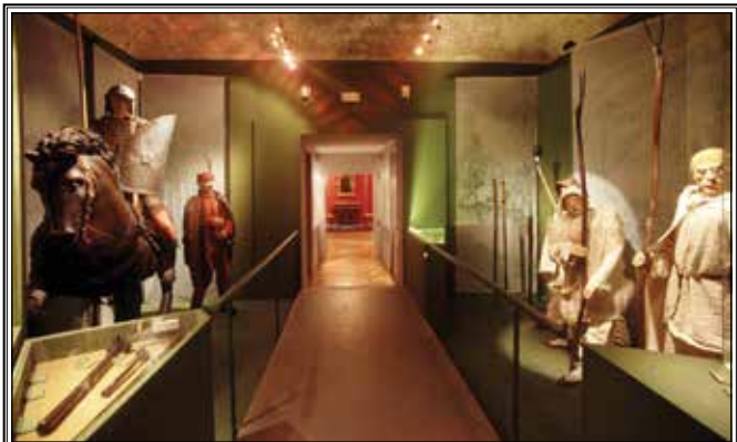
MUZEJ SELJAČKIH BUNA