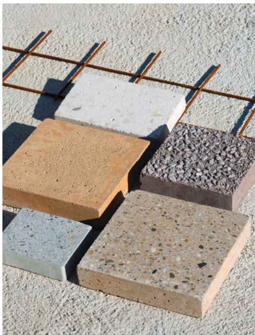
BETON, uzorci specijalnih betona poduzeća Holcim

Poduzeće → Cemex Hrvatska (nekoć Dalmacijacement) iz Kaštel Sućurca proizvodi beton i betonske proizvode. Ima četiri betonare u Hrvatskoj (Zagreb, Varaždin, Zadar, Kaštela) i dvije u BiH, proizvodi betone široke primjene i specijalne betone (pjenobeton, propusni, samozbijajući, vodonepropusni, mikroarmirani, konstruktivni i nekonstruktivni lagani, dekorativni beton). Poduzeće → Nexce (nekoć Našicecement) iz Našica proizvodi betone široke primjene i specijalne betone (lagani nekonstruktivni, obojeni, vidni, samozbijajući, sulfatno otporni beton, beton otporan na habanje, mraz i sol, vodonepropusni beton). Ima betonare u Sesvetama, Stupniku, Sisku, Osijeku, Vinkovcima, Našicama. Poduzeće → Holcim Hrvatska (nekoć Istarske tvornice cementa) iz Koromačnog proizvodi betone široke primjene i specijalne betone (mikroarmirani beton, pjenobeton, betoni za posebne uvjete izloženosti okoline, samozbijajući, propusni, valjani beton). Ima betonare u Kukuljanovu, Karlovcu, Lučkom, Sesvetama (Resnik beton) i Čakovcu (Betaplast).