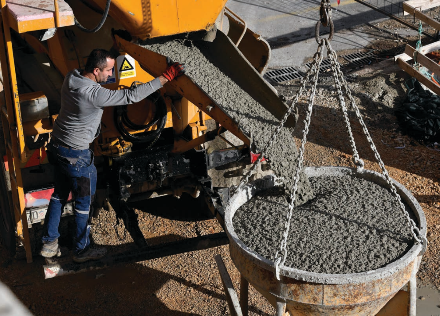
BETON, građevinski radovi na izgradnji podzemne garaže na Poljani, Šibenik, 2019.

beton , građevni materijal koji se dobiva stvrdnjavanjem smjese nekog veziva (npr. cementa), vode i agregata (npr. šljunka i pijeska), a kadšto i od kemijskih ili mineralnih dodataka. U svježem stanju može se lako oblikovati, lijevanjem u kalupe ili oplatu, i taj oblik trajno zadržava nakon stvrdnjavanja. Povoljna konstrukcijska i druga svojstva učinila su beton najzastupljenijim građevnim materijalom današnjice. U znanstvenom i stručnom smislu posebice su važna područja građevinarstva koja su usko vezana uz beton: tehnologija betona, ispitivanje betona (→ građevni materijali), → betonske konstrukcije i dr. U sklopu teorije i tehnologije betona obrađuju se sastav betona, svojstva betona u svježem i očvrslom stanju, projektiranje sastava betona, proizvodnja i ugradnja betona i dr.