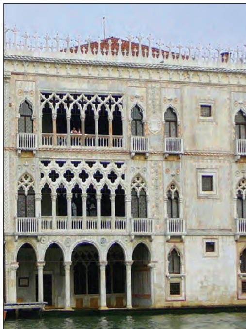
G. i B. Buon, palača Ca' d'Oro, 1422–30., Venecija