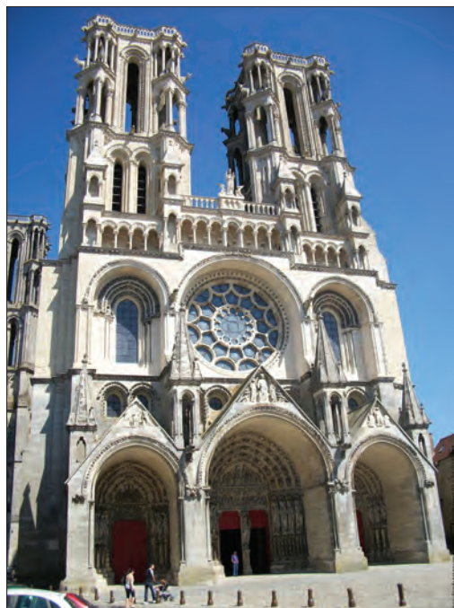
pročelje katedrale Notre-Dame, XII. st., Laon