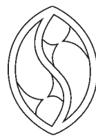
gothique flamboyant, motiv ribljega mjuhura