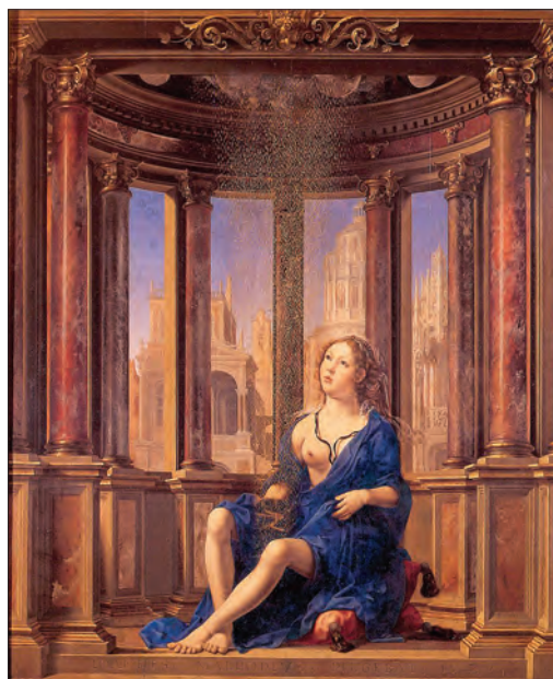
Jan Gossaert, DANAJA , 1527., Alte Pinakothek, München

Göthe, Eosander → Eosander, Johann Friedrich