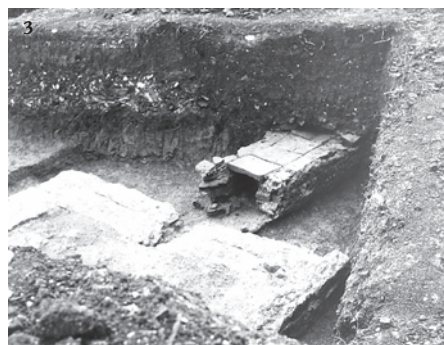
1. Arheolozi na lokalitetu prije početka radova 1953; 2. cisterna; 3. kanal južno od sanitarnoga čvora

Prvi nalazi, kockice rimskoga mozaika, dospjele na površinu oranjem, otkriveni su 1952., nakon čega su o tom obavješteni stručnjaci Arheološkoga muzeja u Zagrebu. Već 1953. započela su prva terenska rekognosciranja i iskopavanja pod vodstvom Marcela Gorenca i Valerije Damevski. Zaštitno-konzervatorski radovi s prekidima trajali su od 1953. do 1983. Utvrđeno je da je riječ o luksuznoj antičkoj ladanjskoj vili s popratnim gospodarskim zgradama. Rimska je vila bila izgrađena na pomno odabranu mjestu, a pri njezinoj su gradnji primijenjena odlična tehnička rješenja za vodoopskrbu, grijanje i kanalizaciju. Otkriveno je ukupno devet prostorija različite namjene. U cijelosti su očuvani kameni temelji, građeni na redove od riječnih oblutaka ili lomljenca vezanih čvrstom žbukom, dok su gornji zidovi od opeke samo mjestimično očuvani. Vila je izgrađena u pravokutnom rasteru s više prostorija različitih dimenzija, a nižu se od zapada prema istoku. Ulazilo se kroz omanje predvorje, potom se iz njega nastavljao prolaz u južnu izduženu prostoriju, uz čiji se jugoza-