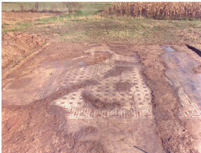
Prostorija s mozaikom (lijevo); dio mozaika sa središnjim medaljonom (desno)

Također su utvrđeni i ostatci rimske ceste koja je povezivala te dvije vile, a koja je paralelna s današnjom cestom Okučani–Lipik–Darugar. Rimske ladanjske vile u Benkovcu i Cagama vrlo su važne građevine kulturne spomeničke baštine, no one su tek dio još uvijek slabo istražene i zacijelo iznimno bogate prošlosti okučansko-novogradiškoga kraja.