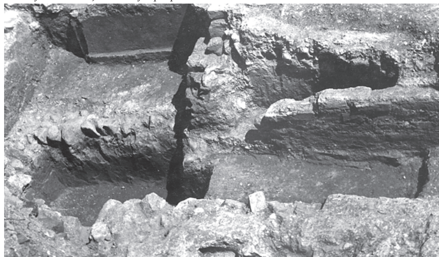
Prostorija s mozaikom, konstrukcija ispod poda

janje prostorija toplim zrakom). Iz nje se stubama ulazilo u istočnu prostoriju, koja se protezala cijelom širinom vile; pod je u njoj bio povišeniji i popločen velikim opekama, koje su tek djelomice očuvane, no od većega dijela ostali su tek otisci na ožbukanoj podlozi. Najveća prostorija u vili imala je mozaični pod, koji je bio povišen otprilike 60 cm. Znatna oštećenja poda omogućila su uvid u način gradnje njegove supstrukcije, načinjene od višeslojne žbukane