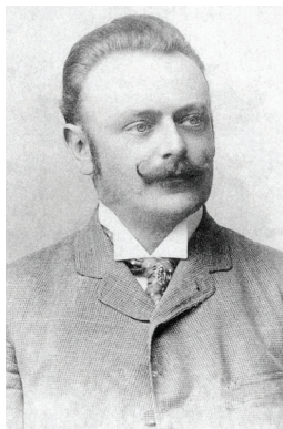
PENKALA, Slavoljub Eduard