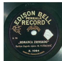
PENKALA, Slavoljub Eduard, naljepnica gramofonske ploče Edison Bell Penkala