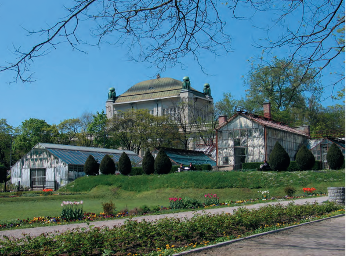
BOTANIČKI VRT PRIRODOSLOVNO-MATEMATIČKOGA FAKULTETA SVEUČILIŠTA U ZAGREBU