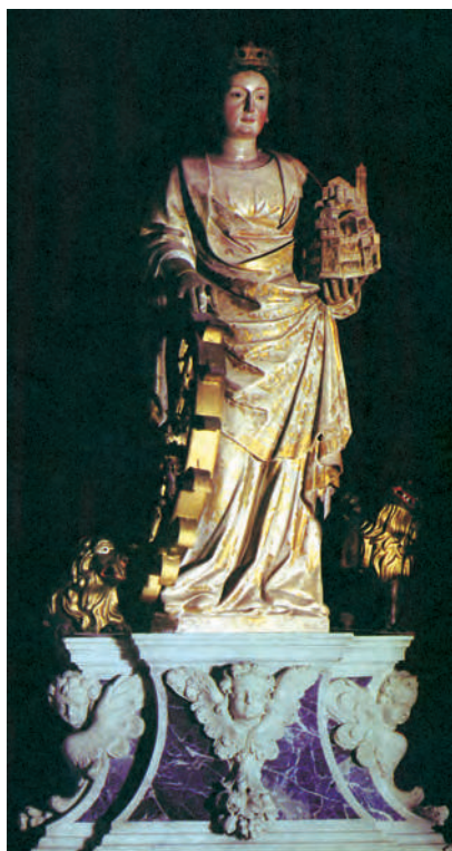
EUFEMIJA, XV. st., Rovinj, crkva sv. Eufemije

prvoj fazi podignuta je u IV. st. javna crkva ostatci koje se nalaze sjeverno od Eufrazijeve bazilike. To je bilo zdanje s trima nejednakim četverokutnim dvoranama, u kojima su sačuvani ostatci podnoga mozaika. Dio sjv. dvorane vjerojatno je služio kao krstionica. U crkvu se ulazilo kroz narteks koji je imao keramični mozaični pod, a sa sjv. strane bio je zaključen polukružnom apsidom. Ta je crkva podignuta na mjestu starijih rim. profanih građevina, zidovi kojih su djelomično iskorišteni za crkv. gradnju. Starija historiografija tumačila je dio struktura tih rim. kuća kao ostatke tajne kršč. bogomolje iz predkonstantinovskog razdoblja ( domus ecclesia ), sve povezujući s podacima