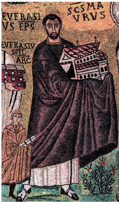
Biskup EUFRAZIJE, VI. st., Poreč, Eufrazijana

Eufrazije (lat. Eufhrasius i Eufrasius , grč. Εὐφρασῖος), porečki biskup (Trakija, kraj V. ili poč. VI. st. – ? Poreč, oko 560). O njegovu životu ima malo pov. podataka. Porečkim je biskupom postao oko 540., nakon biz. osvojenja Istre, kao predstavnik Justinijanove crkv. politike. Na mjestu starije i trošne crkve iz V. st. podignuo je velebnu baziliku, po njemu nazvanu → Eufrazijanom (na njezinu je apsidalnom mozaiku prikazan, uz ostalo, i njegov lik). Prema mišljenju većine crkv. povjesničara, nije bio u zajedništvu s papom. U vrijeme previranja u Crkvi oko tumačenja Kristove naravi stao je na stranu biskupa koji nisu prihvatili naizgled kompromisne zaključke II. carigradskoga sabora iz 554 (tzv. spor Triju poglavlja), što ih je potvrdio papa Vigilije. Zapadnokršć. biskupi ubrzo su se počeli vraćati u zajedništvo Crkve, a u raskolu su najduže ustrajali biskupi Istarske, tj. Akvilejske crkve (→ istarski