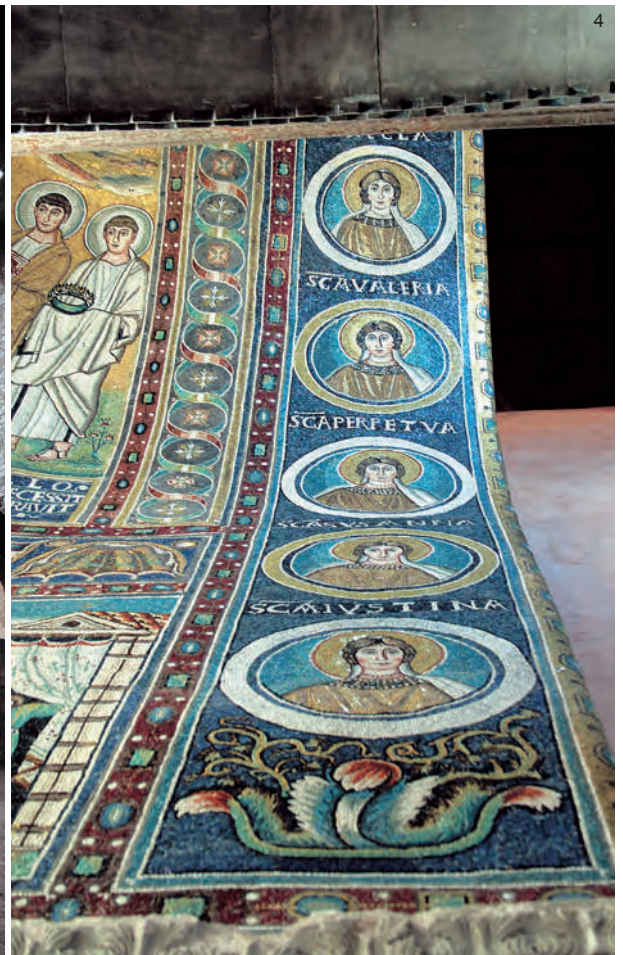
EUFRAZIJANA – (lijeva stranica): 1. kompleks bazilike; 2. atrij; 3. dio oltara, VI. st.; 4. bizantski mozaik u luneti, VI. st.; (desna stranica): 5. ranokršćanski mozaik, IV. st.; 6. detalj ciborija, XIII. st.; 7. freska, XV. st.; 8. glavna lađa i oltar