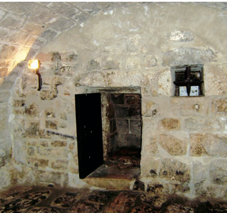
Tamnica »zmaj«, Knežev dvor, Dubrovnik