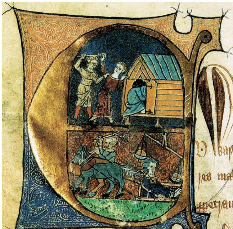
Kažnjavanje pekara, srednjovjekovni inicijal