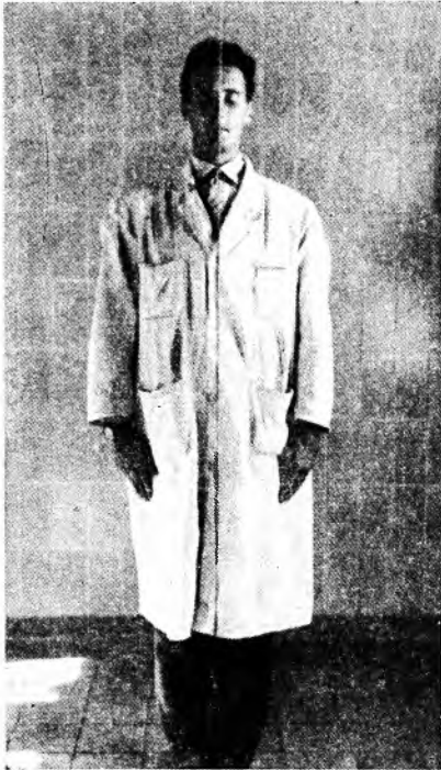
ISPITIVANJE RAVNOTEŽE U ROMBERGOVU POLOŽAJU POMOĆU VRPCE, NA KOJOJ VISI OLOVNI UTEG

bolesnik pretražuje, npr. prema nekom bridu, prema vratima ili prema nekoj crti na zidu. Najbolje je ako se sa stropa prostorije u kojoj se sistematski vrše takve pretrage, spusti tanko uže na kojemu visi olovna kuglica. To uže nam pokazuje apsolutnu vertikalnu, pa možemo Rombergov pokus u običnom položaju provesti iza užeta ili sa strane (vidi slike), imajući potpuno objektivno i sigurno mjerilo da li se bolesnik drži nagnut na jednu stranu, naprijed ili natrag ( épreuve du fil à plombe, de face et de profil ).