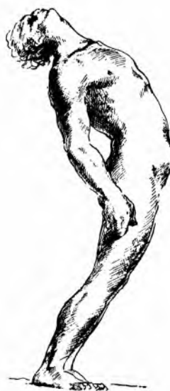
ČOVJEK SA ZDRAVIM LABIRINTOM ODRŽAVA RAVNOTEŽU KOD NAGIBANJA PREMA NATRAG SAVIJANJEM TIJELA

Postoji li kakva poremetnja ortostatike, ispitujemo pomoću Rombergova pokusa. Bolesnik stoji uspravno pred nama sa spuštanim rukama i približenim stopalima. Ponajprije promatramo kako bolesnik stoji dok su mu oči otvorene, a zatim zatražimo da zatvori oči. Ako vidimo da bolesnik mirno stoji i da se ništa ne