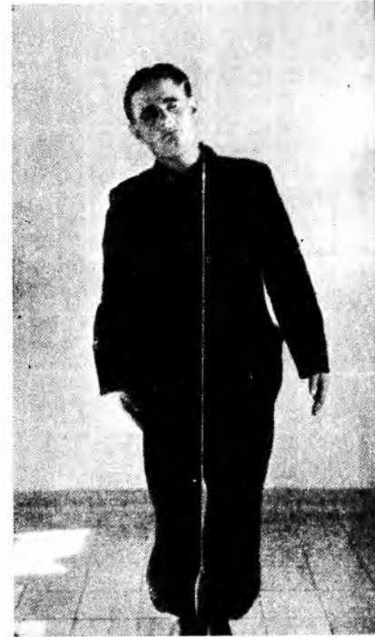
KOD HIPOTONIJE DESNOG LABIRINTA NAGINJE SE BOLESNIK NA DESNU STRANU

Jedina modifikacija originalnoga Rombergova pokusa koja ima praktičnu vrijednost i koja se općenito može preporučiti, jest ona po kojoj se nagib bolesnika ne prosuđuje »od oka«, nego kontrolira prema jednoj vertikalnoj liniji u prostoriji u kojoj se