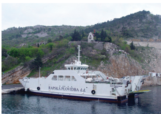
TRAJEKT, Amorella , izgrađen u Brodosplitu 1988. za finsko poduzeće Viking Line ( gore ); ro-pax brod Piana , izgrađen u Brodosplitu 2011. za francusko poduzeće SNC Navale STEF-TFE ( sredina ); Sveti Kristofor , izgrađen u brodogradilištu Viktor Lenac 2003., plovi za Rapsku plovidbu ( lijevo )

Intenzivna izgradnja trajekata za domaće brodare nastavljena je trima većim brodovima duljine 87,6 m, za 100 vozila i 600 putnika izgrađena u Brodogradilištu Kraljevica ( Sveti Krševan , 2004) i u BSO-u ( Supetar i Cres , 2004–05), pet brodova duljine 87,6 m, za 138 vozila i 1200 putnika izgrađenih u Brodogradilištu Kraljevica ( Marjan , 2005; Hrvat i Juraj Dalmatinac , 2007) i BSO-u ( Biokovo , 2009; Jadran , 2010), te s četiri broda duljine 99,8 m, za 145 vozila i 616 putnika izgrađena u pulskom brodogradilištu Uljanik ( Kornati , Brač , Krk i Mljet ; 2014). Trajekt za 100 vozila i 600 putnika Četiri