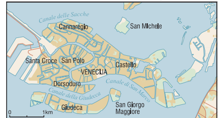
Venecija, plan grada

venecijansko crvenilo (pompejsko crvenilo), vrlo fino raspršen željezni trioksid (Fe 2 O 3 ); upotrebljava se kao pigment u antikorozivnim bojama za željezo i kao sredstvo za poliranje.