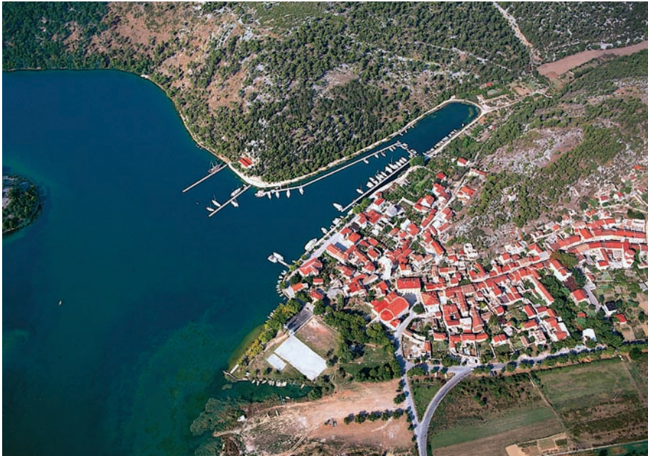
MARINA SKRADIN (ACI)